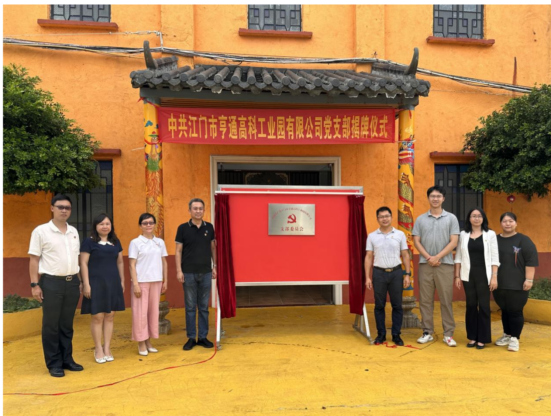
( 江门市亨通高科工业园有限公司党支部揭牌仪式 )